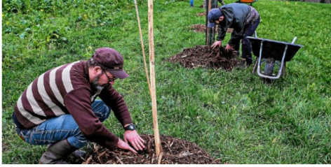
Premières plantations de l'association Les Vigilantes à Quévert et Lanvallay.