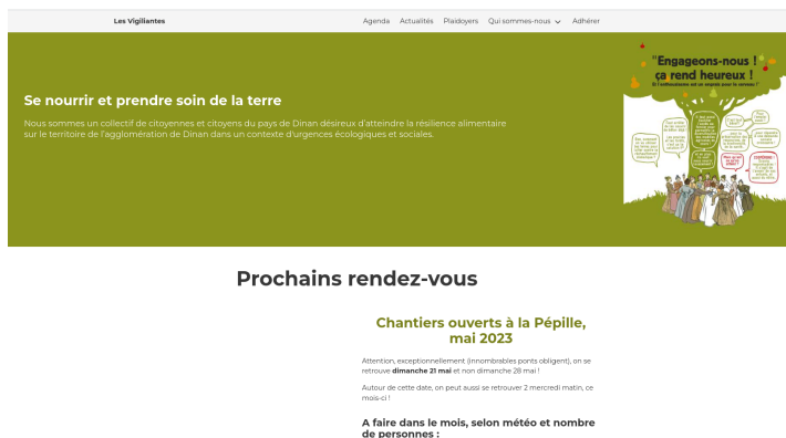
Aperçu de notre site web