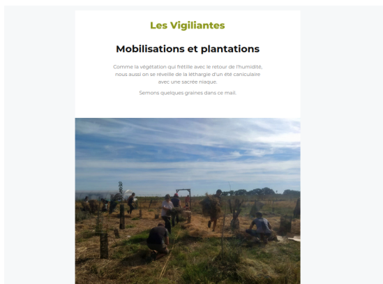
Newsletter septembre 2022