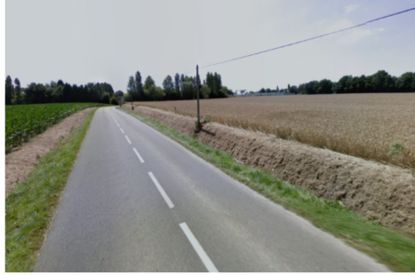
La Vallée Fraissier, des parcelles qui seraient concernées par un projet de lotissement, sur la commune de Quévert.

L'association s'associe aux inquiétudes de certains habitants : l'urbanisation « galopante » de Quévert, aux dépens des terres agricoles nourricières.